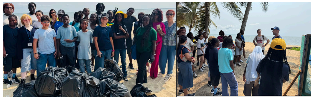
Collecte de plus de 10 sacs de déchets par les éco-délégués