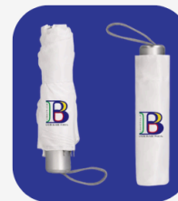
Parapluie 12 000 FCFA