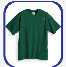
Tee-shirt de sport 3 500 FCFA