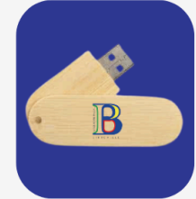
Clé USB 8Go 12 000 FCFA