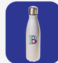
Bouteille isotherme 13 500 FCFA