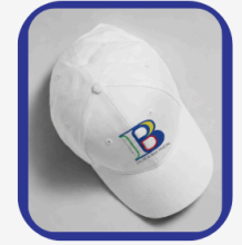
Casquette 6 000 FCFA