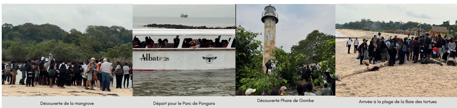
Découverte de la mangrove

L'équipe Education au développement durable (EDD)