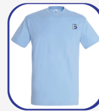
Tee-shirt gris/bleu (collège) 7 500 FCFA