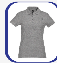
Polo gris/bleu (Lycée) 12 000 FCFA