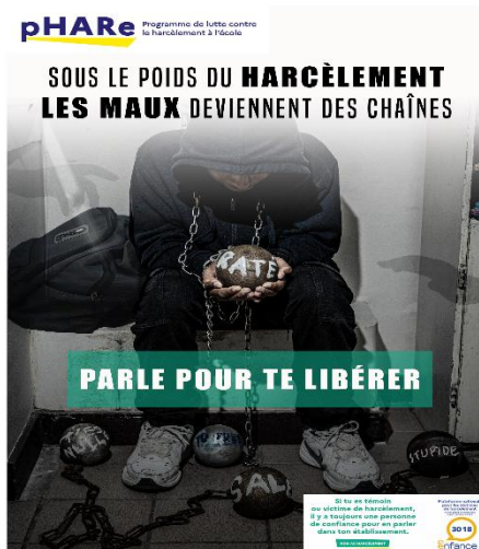
Affiche Lycée Lauréate du Prix NAH Lycée

Deux affiches ont été sélectionnées à la fin d'un vote du personnel : une pour le collège, une pour le lycée. Et c'est notre affiche qui a été primée.